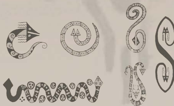
representación de serpientes pinturas-iconogramas originalmente sobre cerámica cultura chaco-santiagueña y noroeste de Argentina