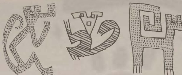
llama y monos dibujos-iconogramas originalmente sobre cerámica cultura ciénaga de argentina

El felino tuvo diferentes significados (la tierra y su poder fecundante, el sol o el cosmos, el poder guerrero, etc. (jaguar, puma, lince, gato montés, etc)