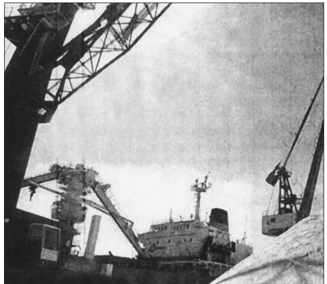
La mayor parte de las materias primas que entran en Castellón proceden de Ucrania y Turquía.

Periódicamente visitan la provincia técnicos argentinos para conocer la realidad empresarial y abrir acuerdos de negocio