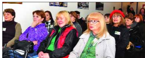
Parte de los asistentes

representación de Universidades de Chile, se sumaron a las importantes delegaciones de Capital, Gran Buenos Aires y Provincia de Buenos Aires, que con su traslado a la ciudad de Mendoza, aportaron fluida concurrencia.