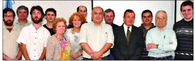
Integrantes de ATAC junto a parte de los asistentes