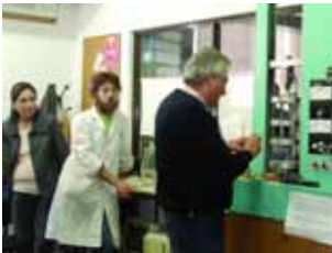
Ensayo mecánico pasantía