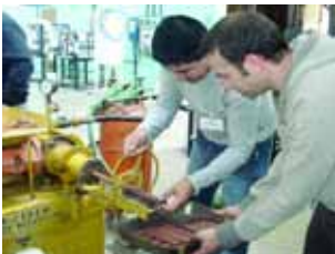
Ensayo de extrusión