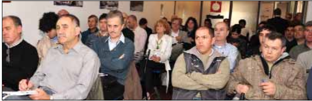
Concurrida asistencia en el salón de actos de ATAC.