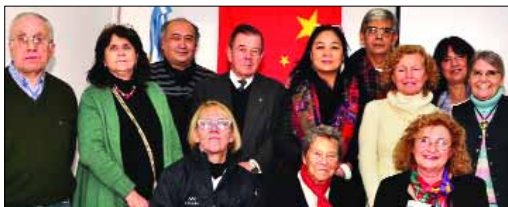
Integrantes de ATAC, ACIA y la Universidad Nacional de Cuyo