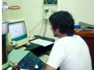
Ensayo porosimetría de mercurio