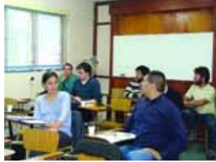
Alumnos pasantes en clase teórica