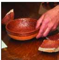
Análisis de muestras defectuosas

- Revisión de conceptos básicos: átomo y molécula; tabla periódica de los elementos químicos; enlace químico; óxidos, bases y sales; átomo-gramo y molécula-gramo; análisis químico; fórmulas químicas y cerámicas.