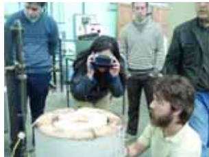
Ensayo de cono pirométrico