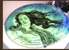
2° Premio Vitrofusión José María Macasso