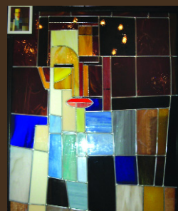
Elvira Rosas 2° Premio Vitral Clásico