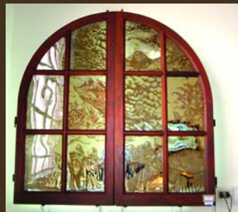
1° Premio Réplicas Griselda Abitante