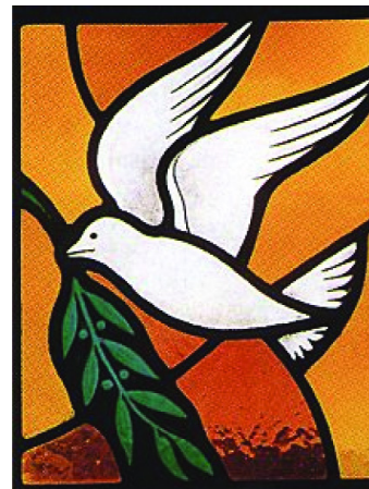
La mayor utilización de los vidrios de color en el Arte se expone en la antigua técnica del Vitral

El modo más confiable y preciso para garantizar la estabilidad de un color dado es hasta hoy la medición espectrofotométrica conforme el método de la Comisión Internacional de Iluminación de 1931, perfeccionado luego por Weiffen. Esta fija un iluminante patrón universal denominado "C" que se corresponde muy bien con la distribución